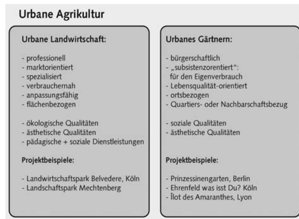
Abb. 1: Formen Urbaner Agrikultur

nischen Sprachraum, aus dem die „urban agriculture“ eingeführt wurde, einfacher werden. Die Übersetzung von „agriculture“ mit „Landwirtschaft“ erscheint naheliegend, ist nicht falsch, führt aber in die Irre. Denn in vielen Ansätzen ist es nicht der Landwirt als professioneller Akteur und Berufsstand, der im Mittelpunkt steht. Neben dem „urban farming“ (Urbane Landwirtschaft) kann der Oberbegriff „urban agriculture“ auch die Ausprägung „urban gardening“ beinhalten. Für die weitere Verwendung ist es daher sinnvoll, ihn als Urbane Agrikultur ins Deutsche zu übertragen. Die Urbane Agrikultur dient als Oberbegriff für die verschiedenen Formen der Primärproduktion in der Stadt und stellt deren kulturelle Prägung, deren besondere urbane Ausformung in den Mittelpunkt. Abb. 1 zeigt, welche weiteren Formen sich unter diesem Oberbegriff versammeln lassen.