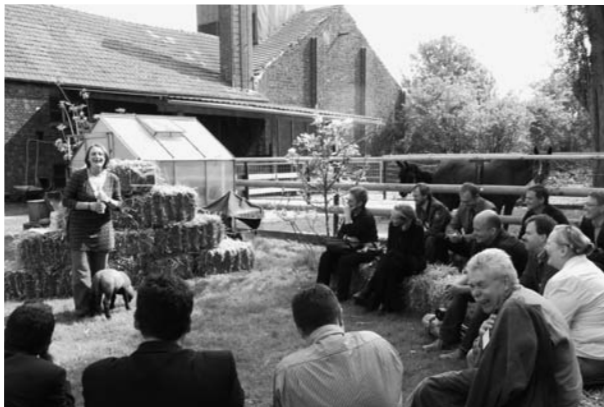
Abb. 2: Landwirtschaft und Pädagogik auf dem „Bauernhof am Mechtenberg“

Der Begriff „Stadtteilbauernhof“ kann heute nicht mehr nur für eine pädagogische Einrichtung von Kommunen stehen, sondern auch ein Geschäftsmodell sein. Diese Landwirtschaft vermarktet nicht mehr nur ihre spezialisierten Produkte an die Stadtbevölkerung, sondern öffnet dieser auch den Hof und bietet besondere Dienstleistungen und Services an. Das beginnt mit der Pensionspferdehaltung und setzt sich fort im Angebot von Umweltpädagogik oder Freizeit- und Erlebnisveranstaltungen (Maislabyrinth, Kindergeburtstag auf dem Bauernhof etc., Abb. 2). In einigen Betrieben werden daraus auch soziale Dienstleistungen, z. B. im Bereich der Jugend-, Behinderten oder Altenbetreuung.